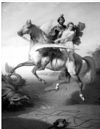
Krafft: Jelenet Torquato Tasso Rüdiger és Angelikájából

Egy pillantás az órákra megmutatja, hogy nagyon elment az idő, pedig csak néhány képet néztünk meg. Jövőre folytatjuk, mert a bécsi képtár festményei még sok csillagkép mondáját illusztrálják!