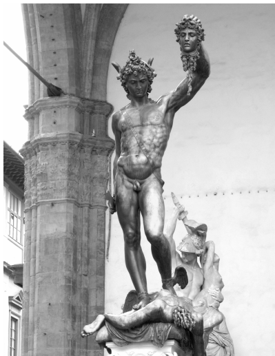
Cellini Perszeusz-szobra Firenzében

Amikor Perszeusz visszatért újáról, elfordított fejjel megmutatta a szörny fejét Polüdektésznek, aki mulatozó társaival együtt nyomban kővé vált. A kör alakban sorakozó sziklákat még ma is mutogatják Szeriphoszbán.