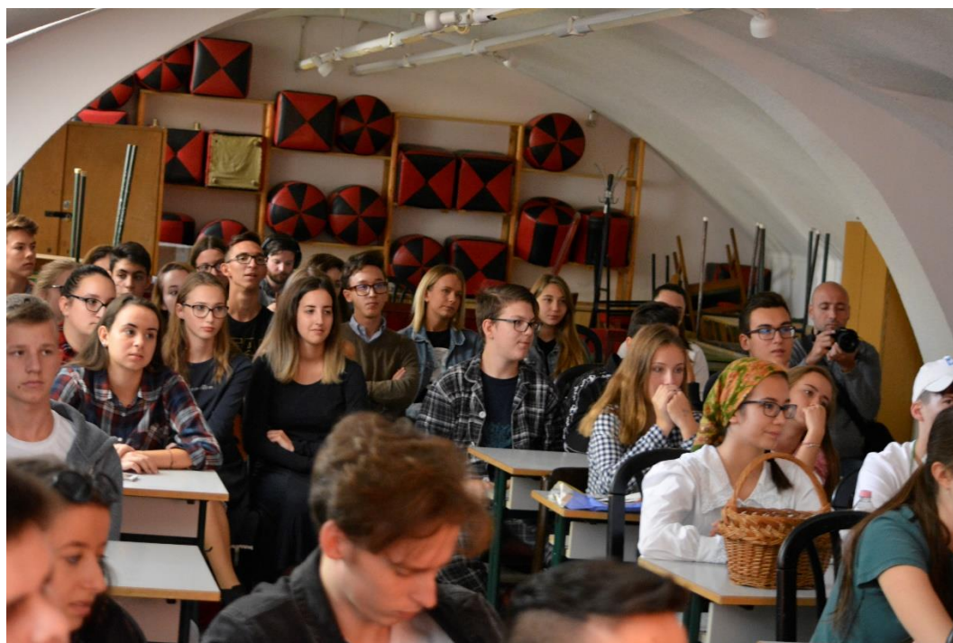
Dabltly és a hallgatóság