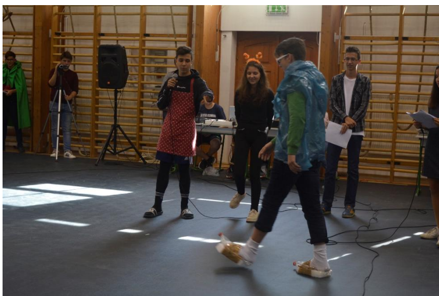
Fenntarthatósági divatbemutató: „légbetétes surranó”