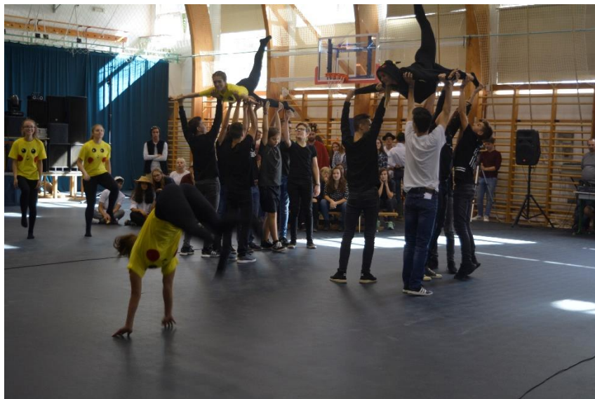
Beindult a hangulat...