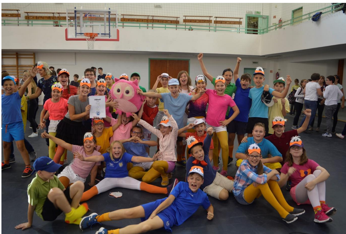
5.N, a győztes osztály

Összeállította: Stárics Roland