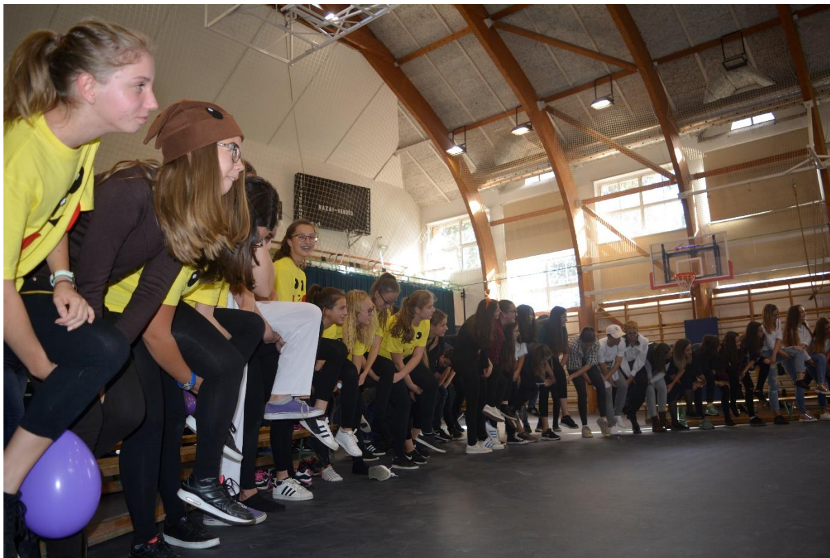
Zárásként fogadalmat tettünk