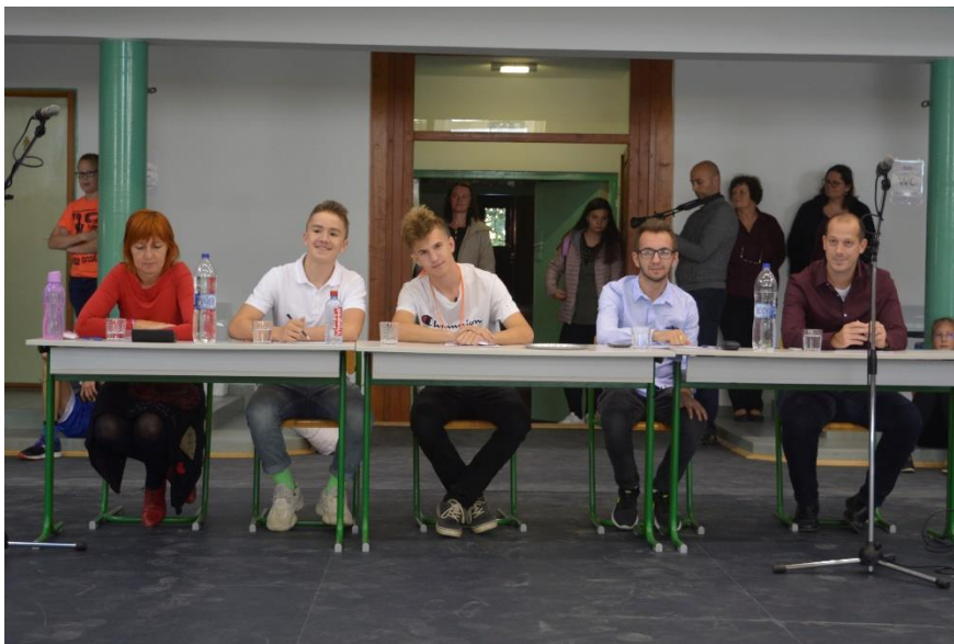
A gólyaavató zsűrije