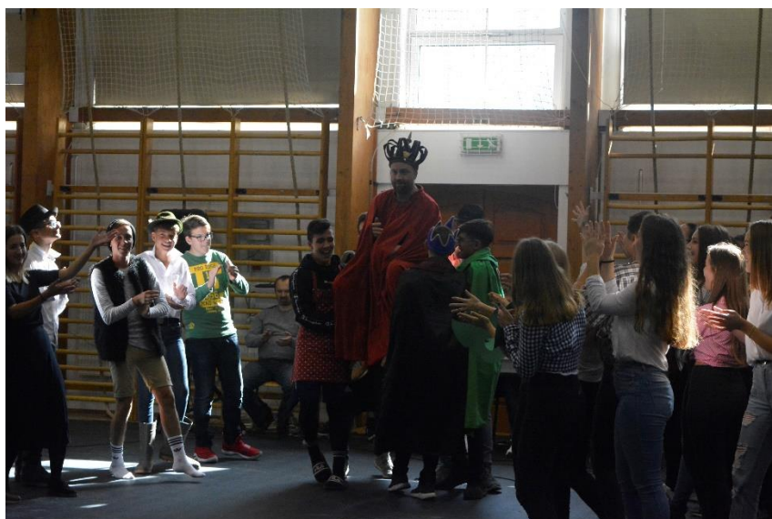
... és tetőfokára hág