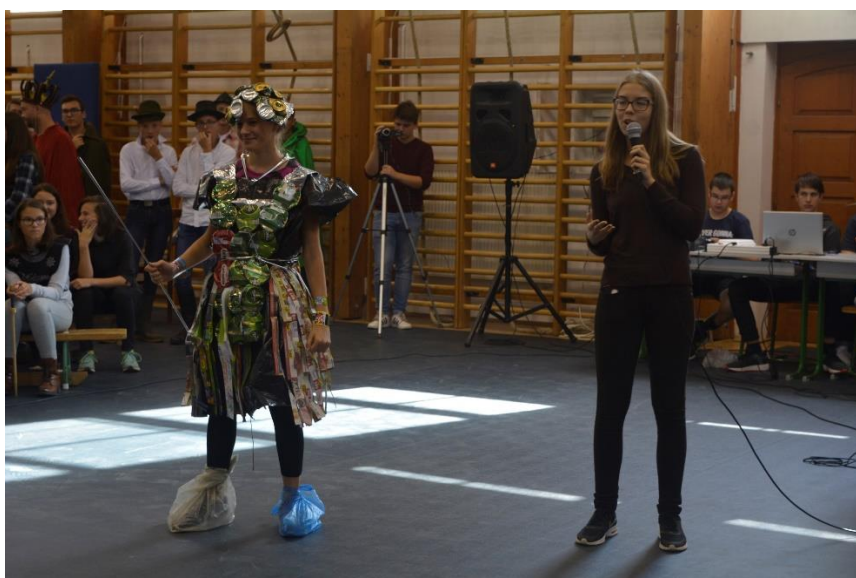
Fenntarthatósági divatbemutató: „Hawaii szoknyás spártai”