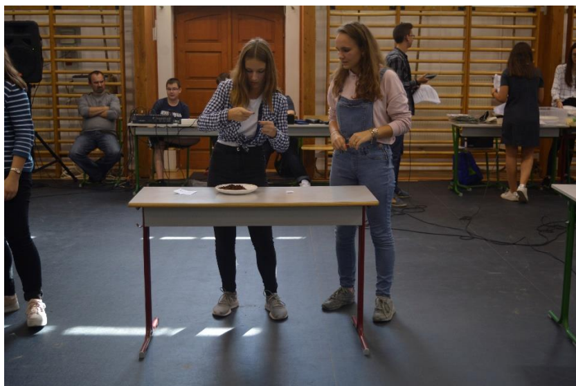
Van ám kézügyesség is