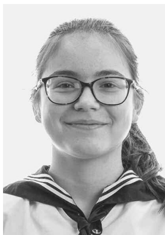
Goldfinger Blanka 8.N/2.