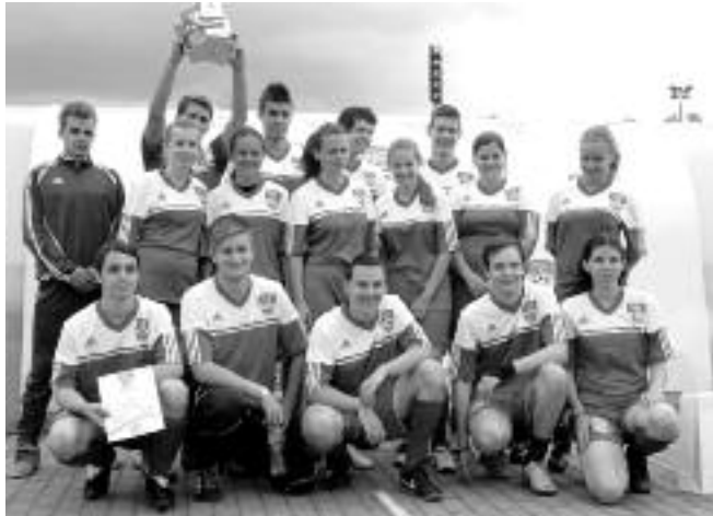
A Coca Cola Cup leány- és fiúcsapata