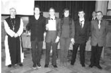
„Ciszterciek, eszmény és valóság az Árpád-korban”