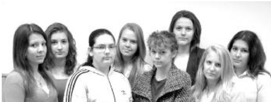
A kézilabdás lányok