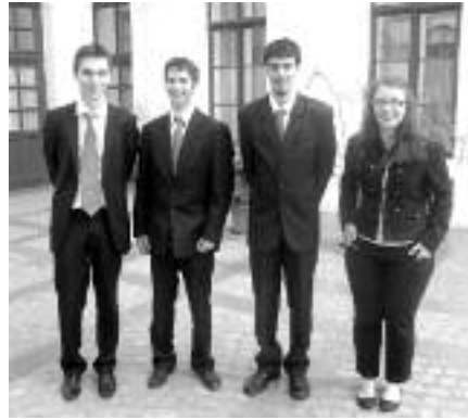
„Polgár az európai demokráciában” az 5. helyezett csapat